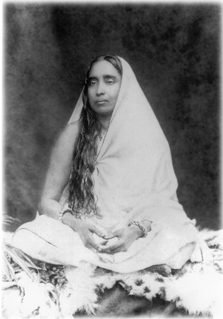
Sri Sarada Devi – Santa Mãe

tobe ekti kothā boli – jodi sānti chāu mā, kārou dosh dekho nā. dosh dekhbe nijer. jogot ke āpnār kore nite sekho. keu por noy, mā. jogot tomār.